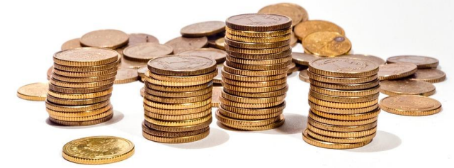
VA avgifter/år och hushåll i medeltal Åland 2020-2024